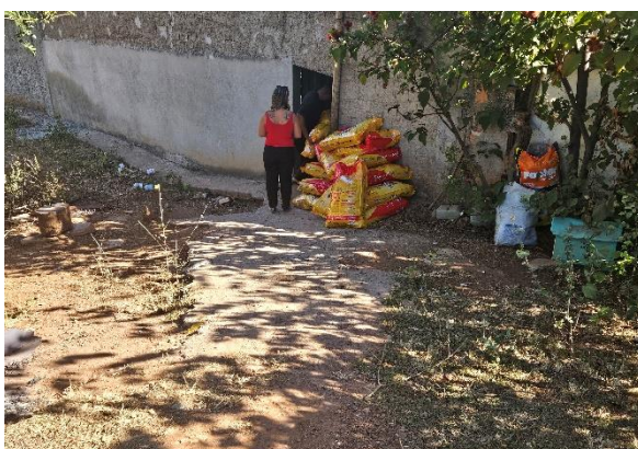
Sacos de ração disponibilizados para a protetora Data: 05/06/2024