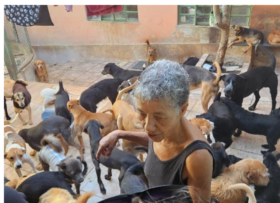
Animais em área de convivência Data: 05/06/2024