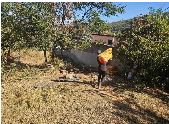
Transporte da ração Data: 05/06/2024