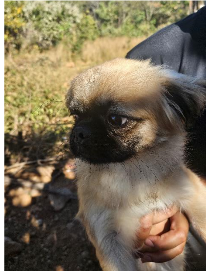
Animal tutelado pela cuidadora Data: 05/06/2024

O projeto está em seu quinto mês de execução e ao final da visita constatamos que o projeto está em andamento e as atividades estão sendo executadas conforme o previsto. Foram repassadas algumas orientações técnicas para aperfeiçoamento do nosso acompanhamento das atividades desenvolvidas.