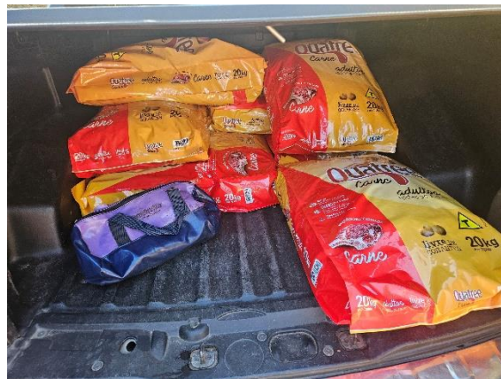
Veículo carregado com ração Autoria: Carolina Rodrigues Bordignon Data: 05/06/2024