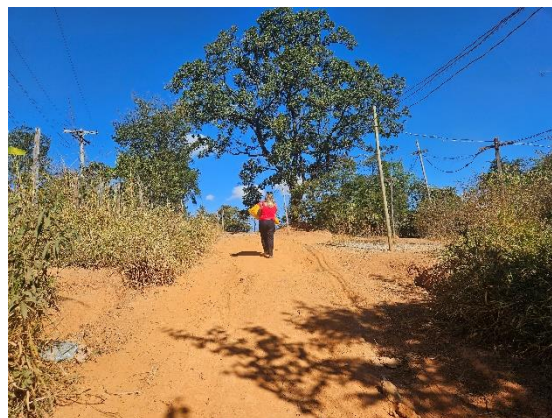
Transporte da ração Data: 05/06/2024