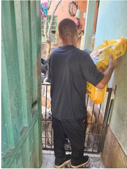
Entrega da ração Data: 05/06/2024